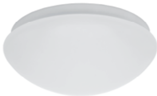
PIRES ECO DL-250

Přisazené svítidlo s vyšším krytím s pohybovým čidlem Prisadené svetidlo s vyšším krytím so senzorom pohybu Mozgásérzékelővel ellátott lámpatest