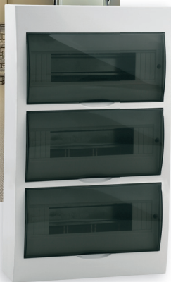
● DB312S 3X12P/SMD