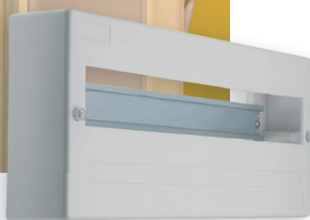
● DB118W 1X18P/SM