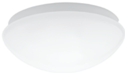
PIRES ECO DL-250 NS