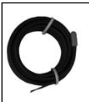
teplotní čidlo ST-1111