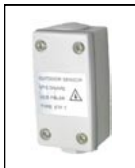
teplotní čidlo ETF-744/99