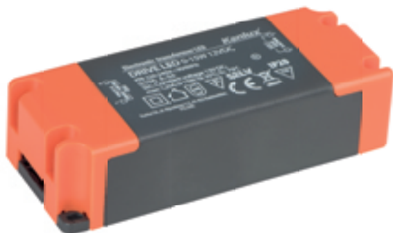
DRIVE LED 0-15W 12VDC