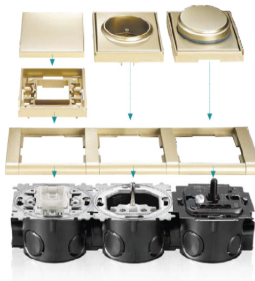
Obr. 3: Sestavování přístrojů s kryty a rámečky