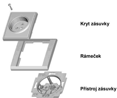
Obr. 5: Sestavování jednonásobné zásuvky s krytem a rámečkem

Do zásuvek zasouvejte pouze vidlice k tomu určené. Vidlice vysouvejte ze zásuvky uchopením za vidlici, nikoliv za kabel. Do otvorů zásuvky nezasouvejte jiné předměty.