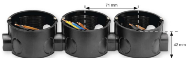
Obr. 1: Sesazení elektroinstalačních krabic pro vícenásobnou montáž