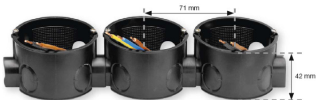
Obr. 1: Sesazení elektroinstalačních krabic pro vícenásobnou montáž